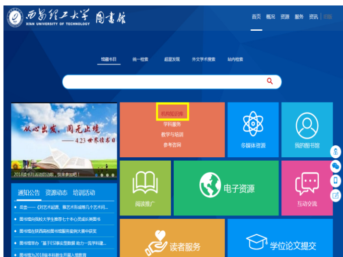
图书馆主页-教学科研支持-【机构知识库】